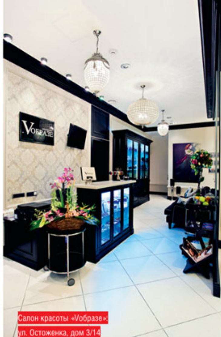
Салон красоты «Vobrazhe» ул. Остоженка, дом 3/14